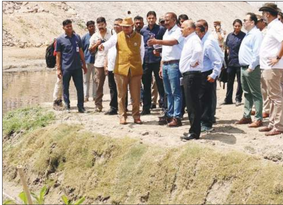
एलजी वजीराबाद में नजफगढ़ ड्रेन की साफ-सफाई के काम का निरीक्षण करने पहुंचे।

देररात उसका प्रेमिका की मां के साथ उनके कुत्ते को लेकर कुछ विवाद हो गया। यह विवाद इतना बढ़ गया कि दोनों में हाथापाई होने लगी। इस दौरान गुस्से में आकर आरोपित ने तमंचा निकालकर महिला को गोली मार दी और मौके से फरार हो गया। स्थानीय लोगों की मदद से आरोपित की गर्ल फ्रेंड ने अपनी मां को अस्पताल पहुंचाया। महिला को फिलहाल आईसीयू में रखा गया है। अस्पताल से सूचना मिलने पर पहुंची पुलिस ने महिला का बयान दर्ज करने के बाद आरोपित के खिलाफ केस दर्ज कर उसे गिरफ्तार कर लिया है।